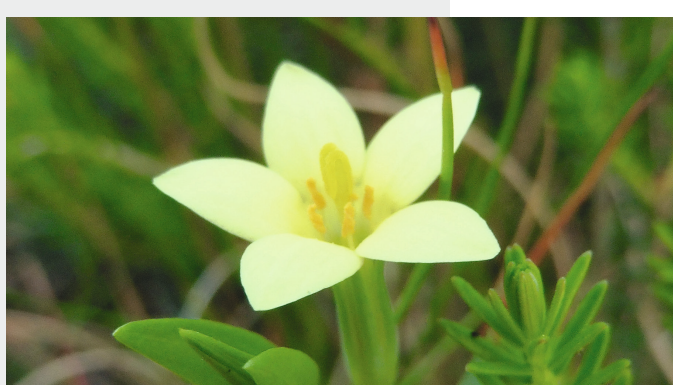
Petite Centaurée maritime ( Centaurium maritimum )

En 2020, la végétation des Chaumes de Sèchebec a fait l'objet d'une observation attentive, à la recherche des espèces rares et menacées au niveau départemental, régional, national ou même européen. Ce suivi, reconduit régulièrement, a confirmé l'existence d'une flore remarquable sur les Chaumes de Sèchebec, en particulier sur les pelouses sèches et calcaires du site.