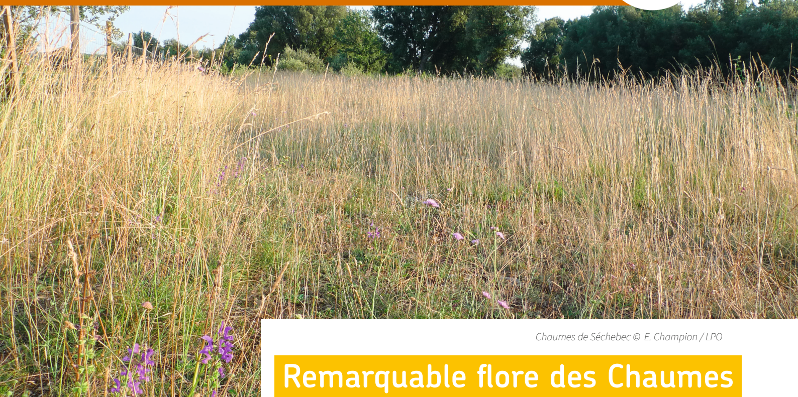
Chaumes de Sèchebec