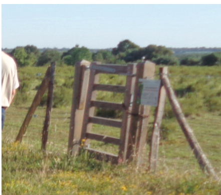
Portillon faisant office d'échalière

De nombreux portillons et échaliers ont été disposés régulièrement le long des clôtures, afin que chacun puisse continuer à se promener, observer et profiter du site, dans le respect des milieux et des espèces.